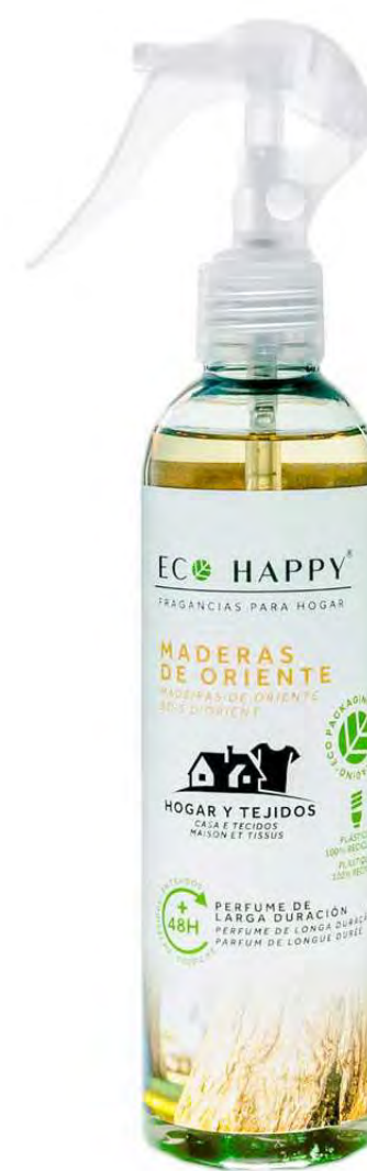
EAST WOODS - PECT003