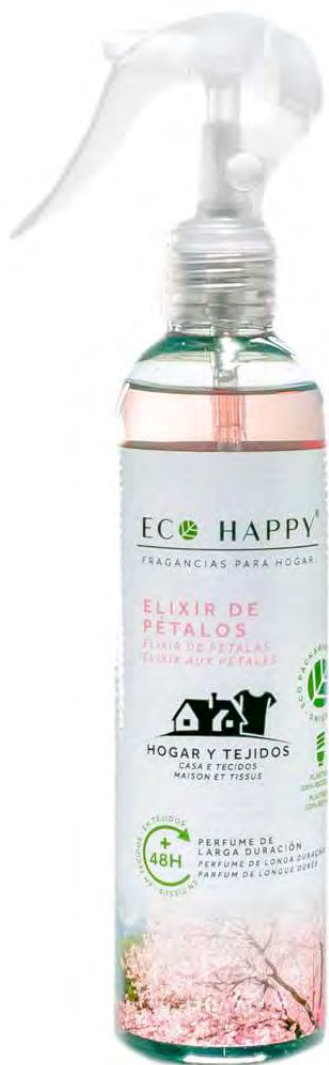
PETAL ELIXIR - PECT001