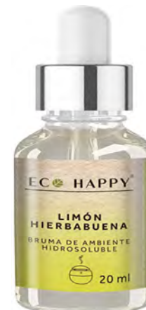
Bruma Menta e Limão Ref: Hum011

Seu aroma intenso ajuda a reduzir o stress. Além disso, estimula as faculdades criativas e o apetite sexual, tornando-se um perfeito energizante e afrodisíaco. O aroma de canela é usado em sessões de aromaterapia devido aos seus benefícios para a saúde.