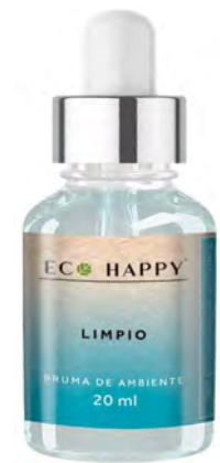
Bruma Limpio Ref : Hum0012

Propriedade: relaxante O aroma da lavanda tem propriedade relaxante, sendo ideal para ajudar a adormecer. Além disso, é fortemente aromático e atua como repelente de traças.