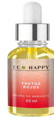
Bruma Frutos Vermelhos Ref : Hum002

A combinação das essências destas duas plantas dá origem a um agradável aroma mentolado e doce, com notas frescas e penetrantes.