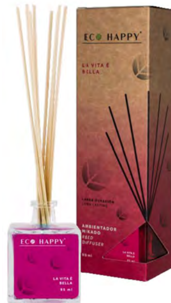
LA VITA È BELLA - MEVB Intensidade ● ● ●