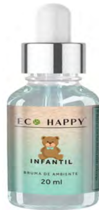
Bruma Infantil Ref : Hum005

Cartão kraft com origem em florestas sustentáveis