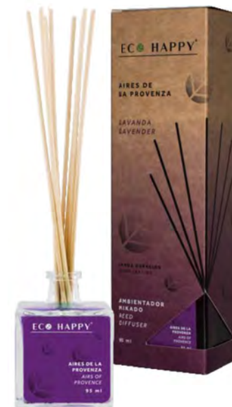
LAVENDER - MEAP Intensidade ● ● ○