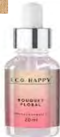
Bruma Rosas Ref : Hum0014

Propriedade: anti-stress O aroma limpio é um concentrado de óleos essenciais de coco, manga e ananás. Possui propriedades aromáticas. Reduz a ansiedade e promove o relaxamento, alivia dores de cabeça e outras dores crônicas, melhora o humor e o bem-estar pessoal. Além disso, promove o apetite sexual.