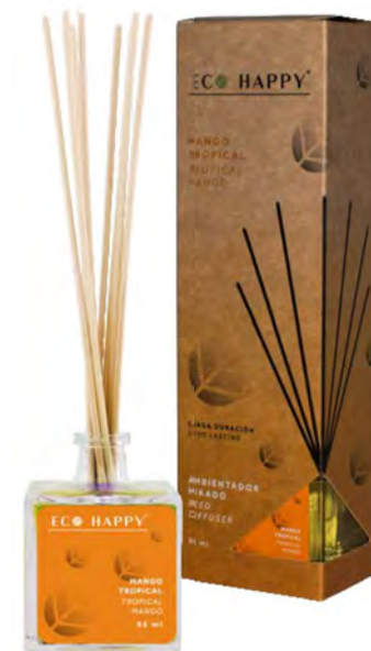
TROPICAL MANGO - MEMT Intensidade ● ● ○