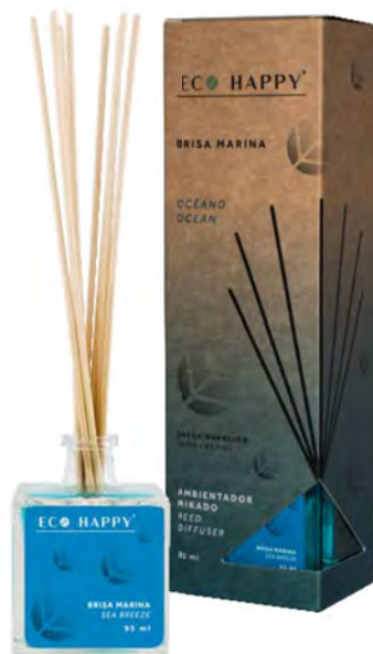
OCEAN - MEBM Intensidade ● ● ○