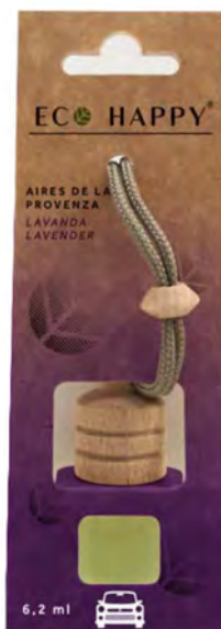
LAVENDER - CE008 Intensidade ●●○