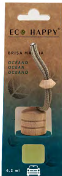
OCEAN - CE003 Intensidade ●●○