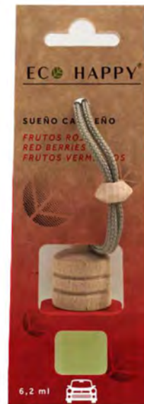
RED BERRIES - CE002 Intensidade ●●●