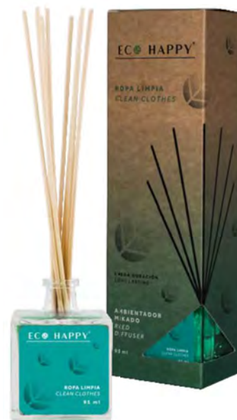
CLEAN CLOTHES - MERL Intensidade ● ● ○