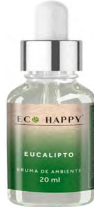
Bruma Eucalipto Ref: Hum014

Concentra essências de tangerina, laranja, limão e lima para criar um ambiente fresco e divertido, ideal para os mais pequenos da casa.