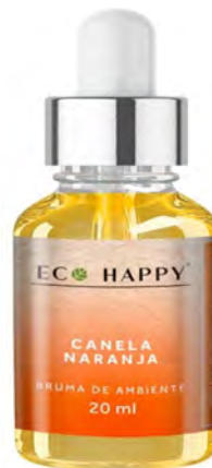
Bruma Canela e Laranja Ref : Hum003

Floral Seus óleos essenciais exalam um aroma agradável e cativante que estimula o humor, relaxa e alivia o stress. O perfume da rosa tem propriedades terapêuticas físicas e emocionais. Atua como estabilizador para asma e tosse. Diminui e acalma as oscilações de humor, sintomas de ondas de calor e fadiga. Também reduz a ocorrência de depressão, insônia e dor de cabeça.