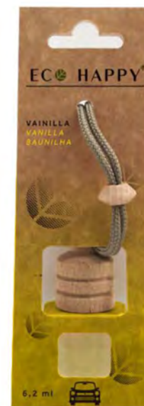
VANILLA - CE001 Intensidade ●●●