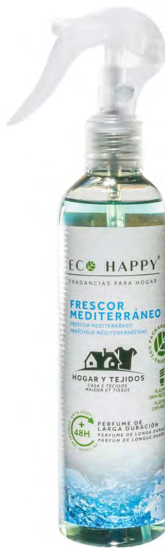
MEDITERRANEAN FRESHNESS - PECT002