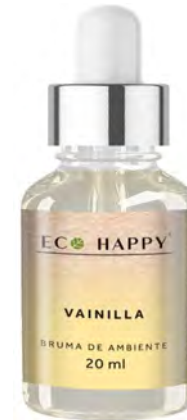
Bruma Baunilha Ref: hum001

Propriedade: refrescante O aroma do eucalipto ajuda a combater problemas respiratórios, pois relaxa e dilata os músculos da traqueia, brônquios e pulmões, aliviando desconfortos em estados gripais, bronquite e congestão pulmonar.