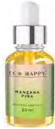
Bruma Maça e Ananás Ref : Hum0013

Concentra essências de framboesa, cereja, amora, romã, melancia, morango, ameixa vermelha, romã e tomate. O aroma de frutas vermelhas tem efeitos positivos no bem-estar emocional. Sendo um aroma doce com notas frutadas, traz tranquilidade e relaxamento. Além disso, possui propriedades terapêuticas que ajudam a clarear a mente e promover a concentração.