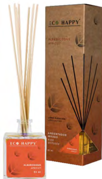
APRICOT - MEALB Intensidade ● ● ○