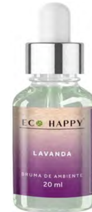
Bruma Lavanda Ref: Hum004

Concentra as principais essências desta planta em seu frasco. Exala um suave aroma de resina, com notas balsâmicas doces.